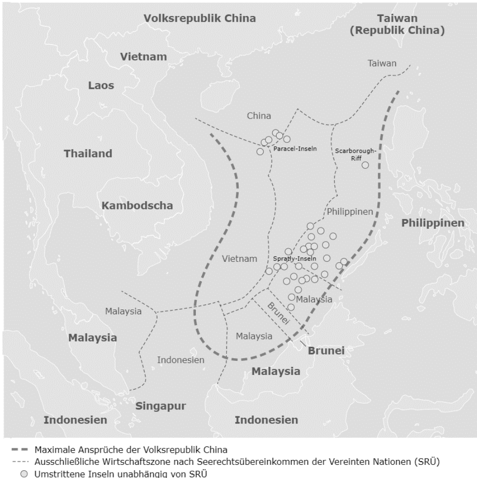
Abbildung 4: Die Überschneidung der historischen Ansprüche Chinas mit den völkerrechtsbasierten Ansprüchen der Küstenstaaten

Quelle: Arase, Kommt es zum Showdown? Die Grenzstreitigkeiten im Südchinesischen Meer und das Ringen um Asiens Zukunft, vom 21. April 2017, 72.