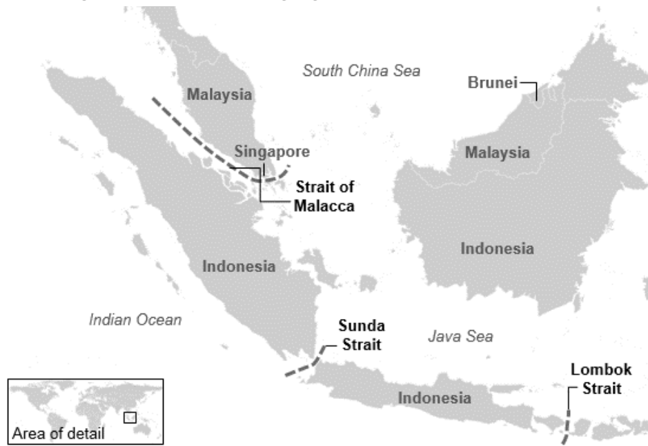
Abbildung 1: Die maritimen Zugänge zum Südchinesischen Meer